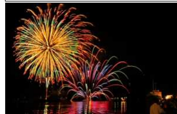
日向みなと・夢・みらい花火大会(7月)