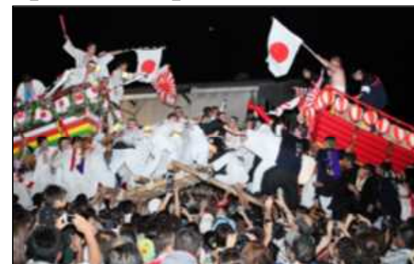
細島みなと祭り(7月)