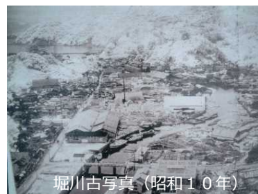
堀川古写真（昭和10年）