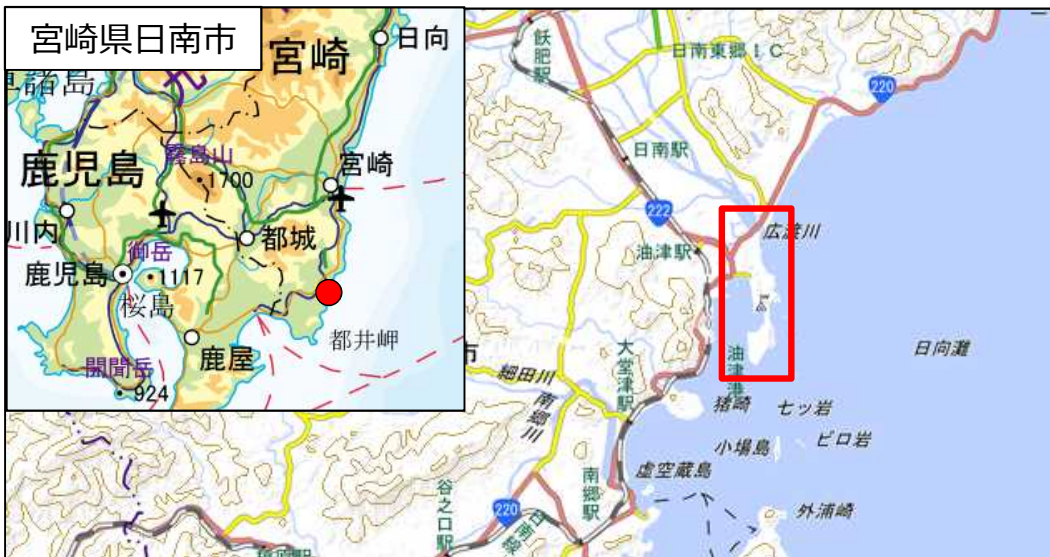
国土地理院地図（電子国土Web）( http://maps.gsi.go.jp )をもとに国土交通省作成