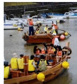
「チヨロ船」乗船体験