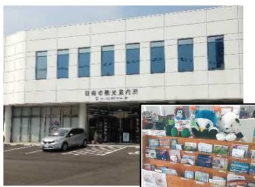
「日南市観光案内所」