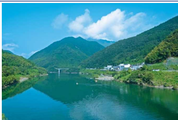
さめうらダム湖と大川村遠景