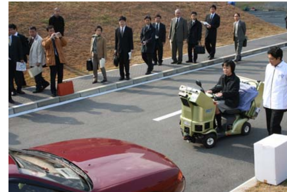
小型車両ロボットI-CW（ユーザ搭乗型移動端末）による公道走行実験(2005年11月24日)

その目指すべき都市像とは、「市民や研究者の知による、生産や文化が創出され新しい価値が創造されるとともに、持続可能社会での住まい方や生き方が創造・発信される都市」である。またその実現に向けて、「実証実験」の展開、「体験し学ぶ新たな観光」等の推進といった学研都市のフィールドを活用した創造の場の形成を図る。