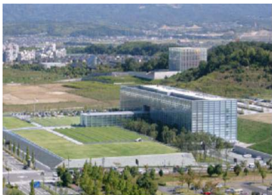
我が国のアジア関係情報やデジタルアーカイブの拠点として期待される「国立国会図書館関西館」

国会図書館関西館二期事業、平城遷都1300年記念事業の展開による文化拠点の高度化や施設の整備充実または各施設間の連携により、新たな文化学術研究を推進していく。また、これまで文化遺産に関する保存修復、研究活動が積極的に展開されている実績を活かし、引き続き文化遺産の保存修復などによる国際的な活動、国際貢献を推進していく。