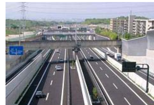
学研都市と大阪方面とのアクセス向上のため、全線供用が求められる第二京阪道路

学研都市は、「都市の建設段階」（セカンド・ステージ）から、現在「建設推進・高度な都市運営の段階」（サード・ステージ）を迎えつつあり、今後は、関西全体で学研都市を支え・推進する体制づくり、学研都市を一体化した新たな運営組織づくり、学研都市全体の産学官連携組織の構築を図る。