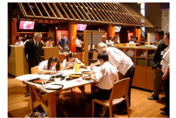
「体験し学ぶ新たな観光」の推進に向けて期待される体験型学習施設「私のしごと館」