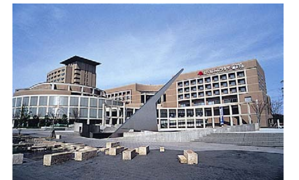
学研都市の新たな都市運営展開の拠点となる「けいはんなプラザ」