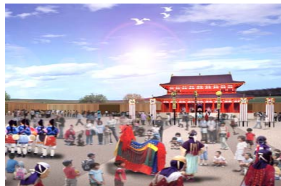
2010年開催の平城遷都1300年記念事業における復原された「大極殿正殿」前のイメージ