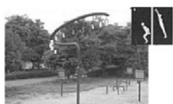
ジャンプ運動ができる施設