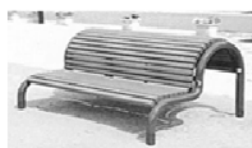
背伸ばし運動ができる施設