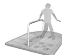
足つぼを刺激する施設