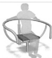
ストレッチ運動ができる施設