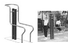
懸垂運動などができる施設