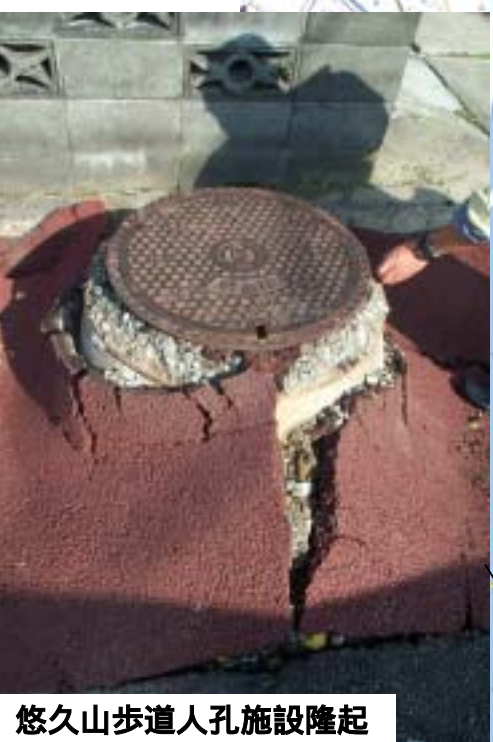
悠久山歩道人孔施設隆起 人孔施設隆起 悠久山歩道管路施設路面異常