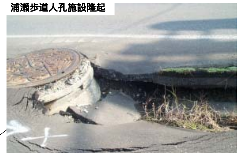
浦瀬歩道人孔施設隆起