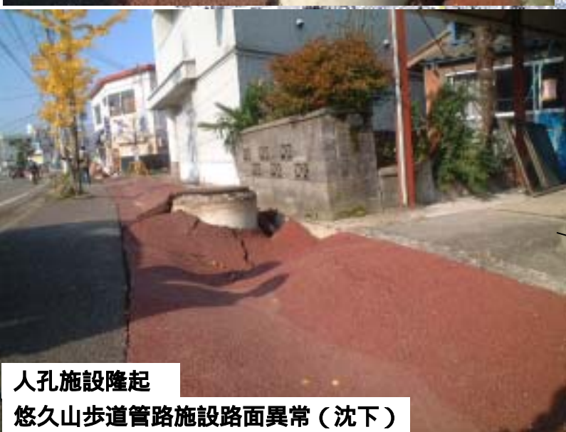
人孔施設隆起 悠久山歩道管路施設路面異常（沈下）