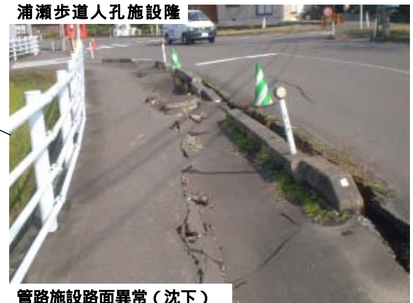
浦瀬歩道人孔施設隆