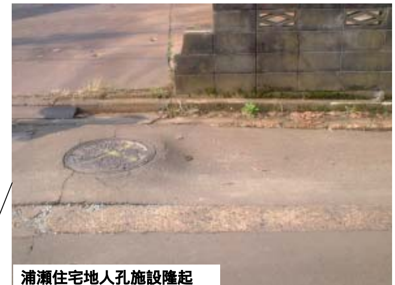
浦瀬住宅地人孔施設隆起