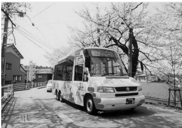
金沢ふらっとバス

オムニバスタウン計画に基づきながら、バスICカードシステムの多機能化によるバス利用の利便性・魅力の向上、多様なバス料金システムの検討、沿線商店街や地元住民との連携による利用促進の検討、バス停のバリアフリー化による誰もが利用しやすい交通環境づくりを進めるとともに、中心市街地のマイカー通勤を減らすなど、公共交通の活性化に向けた事業に取り組んでいきます。