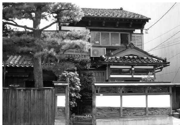
まちなか定住促進事業

さらに、武蔵ヶ辻地区にある近江町市場再開発ビル内に子育て支援施設や市民交流センター（近江町交流プラザ（仮称））を開設し、まちなか交流活動の活発化を図るとともに、中心市街地エリアにおいて、戸建て住宅や共同住宅の建設又は購入、昭和20年以前に建てられた木造建築の外観改修等に対して助成を行うことで、まちなか居住・定住を支援していきます。