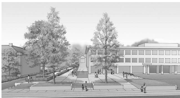
玉川こども図書館（仮称）

また、少子高齢化に対しても、安心して快適なまちなかの暮らしをサポートしていくため、障害のある方や高齢者等の社会・日常における自立を図る金沢福祉用具情報プラザの運営、中心市街地での老人福祉施設の建設、子どもたちの豊かな感性を育む玉川こども図書館（仮称）整備事業などを推進します。