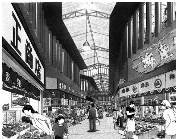
近江町市場アーケード架け替え事業

武蔵ヶ辻地区における新たな交流拠点と期待される近江町市場再整備事業の推進に加え、近江町市場アーケード架け替え事業、近江町市場商店街共同店舗設置事業を進めるとともに、商店街が取り組む各種活性化事業を支援します。さらに、中心市街地業務集積促進事業によって、金沢駅前～広坂間におけるオフィス街の空室率の改善を図るとともに、かなざわファッションストリート創出事業によりオフィス街に新たな魅力を生み出すことで、都心軸沿線の活性化につなげていきます。