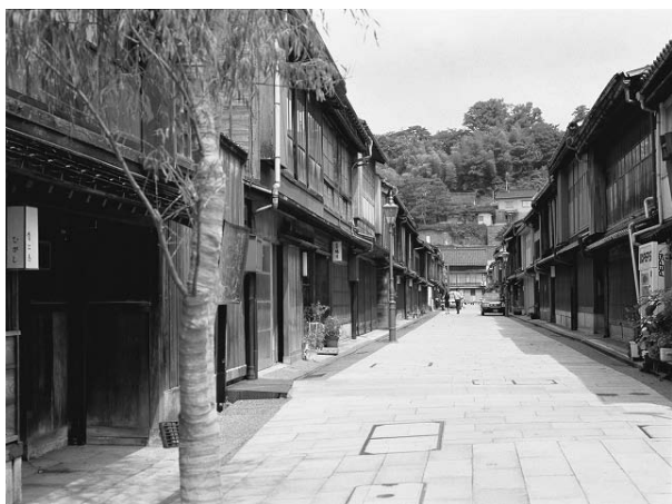
東山ひがし茶屋街

筋、坂道や用水沿いの修景整備、活用に努め、潤い豊かな美しいまちづくりに取り組んでいきます。