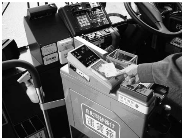
バスICカード (ICA: アイカ)

とりわけ、バスICカードを活用したバス利用の利便性・魅力の向上については、平成19年2月からエコポイント制度を導入し、マイカーから公共交通への利用転換を促し、市民・交通事業者・商業者等が一体となって、過度に自動車に依存しない中心市街地づくりに取り組んでいきます。