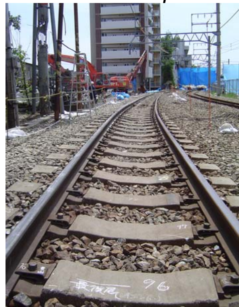
車両の撤去後、列車の停止位置後端付近から尼崎駅方を撮影