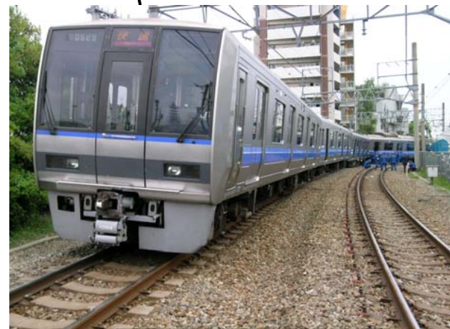
列車の停止位置後端付近から尼崎駅方を撮影