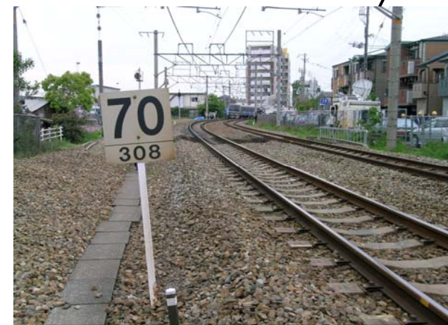
緩和曲線終点及び速度制限標識付近から尼崎駅方を撮影