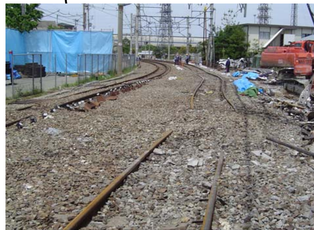
車両の撤去後、マンション付近から宝塚駅方を撮影