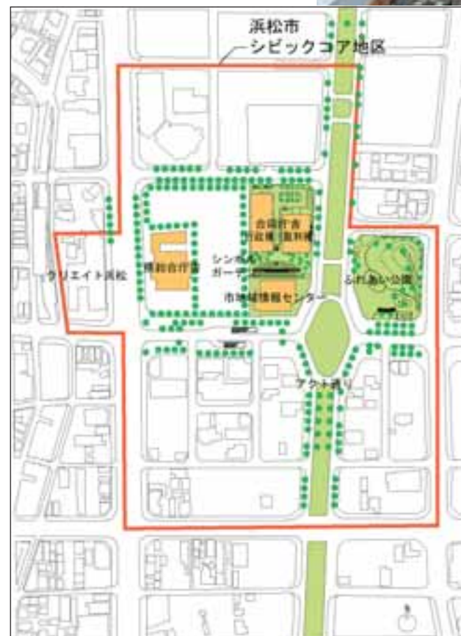
地区全体の配置図