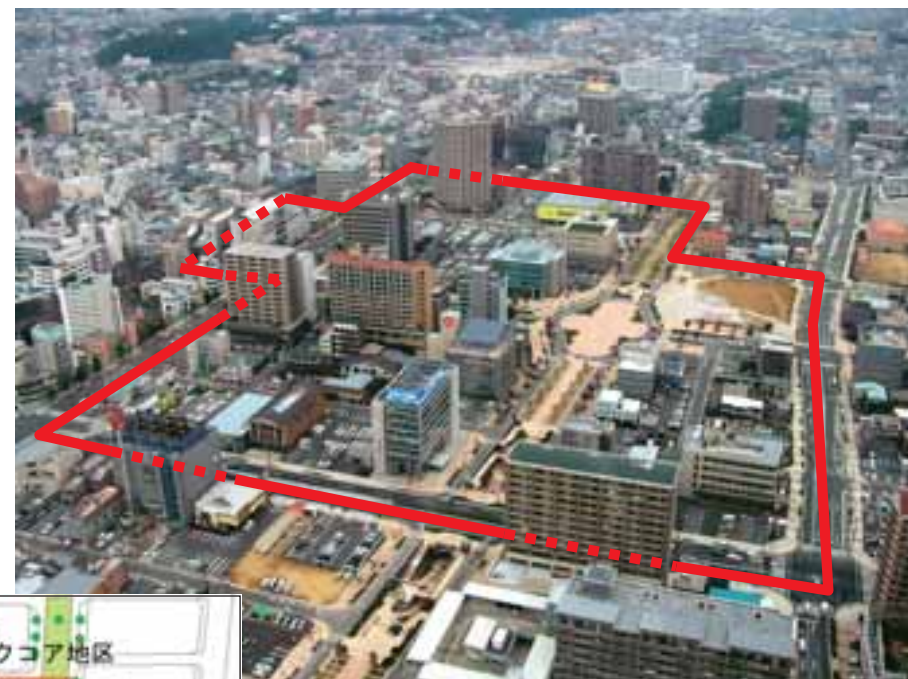
地区全体の航空写真