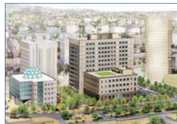
東側より官公庁街区を望む