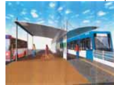
広島電鉄平良駅の整備イメージ