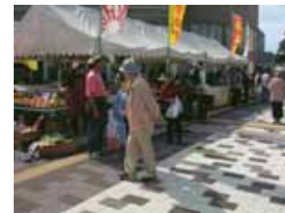
ふれあい通り沿道の活用 (廿日の市)