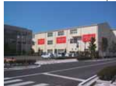
既存の工場を再利用した商業施設