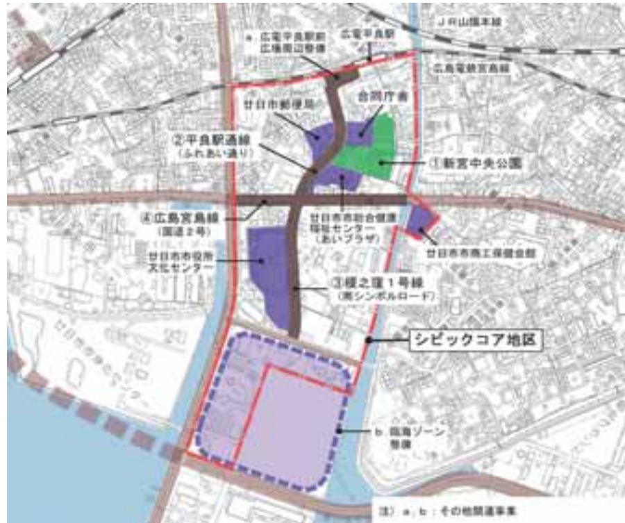
シビックコア地区の区域図