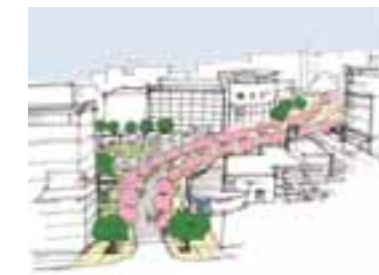
ふれあい通りの空間イメージ