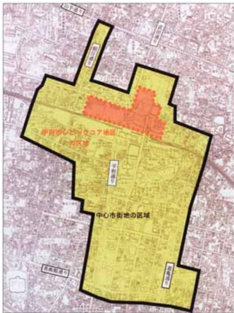
シビックコア地区の位置