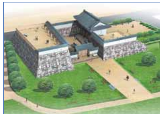
歴史公園（山手門・渡櫓門）の整備イメージ