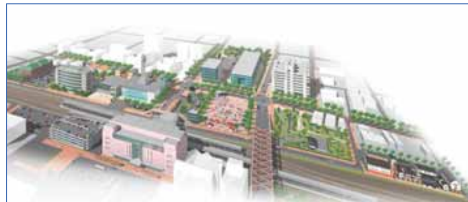
地区全体のイメージパース