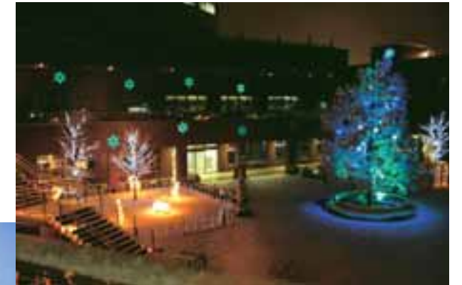
イルミネーションイベントの様子