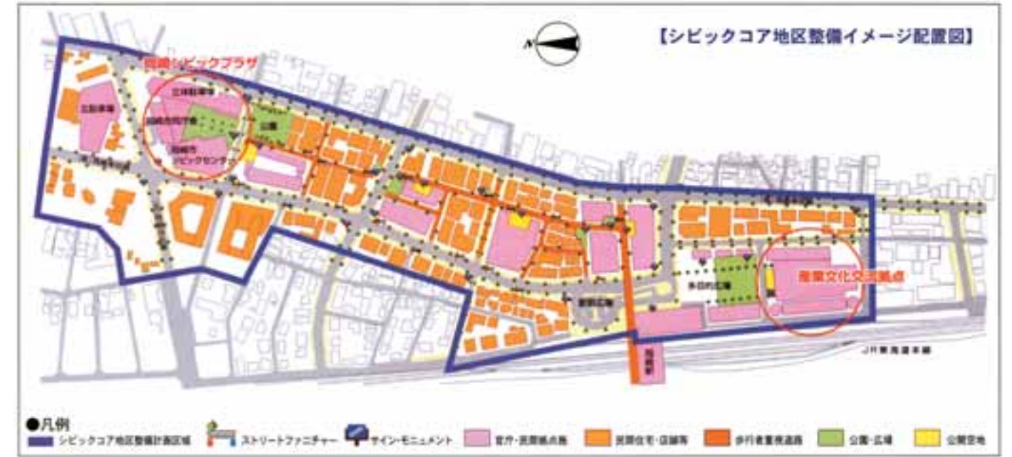
地区全体の配置図