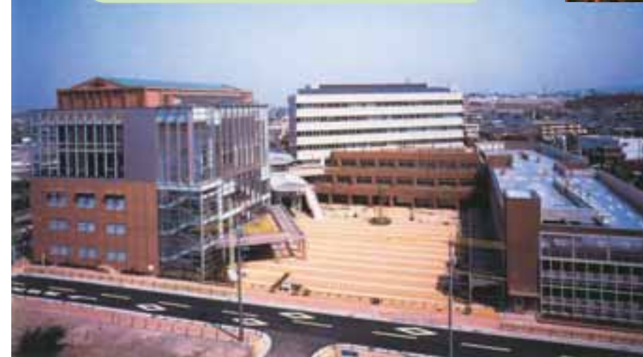
岡崎シビックプラザ