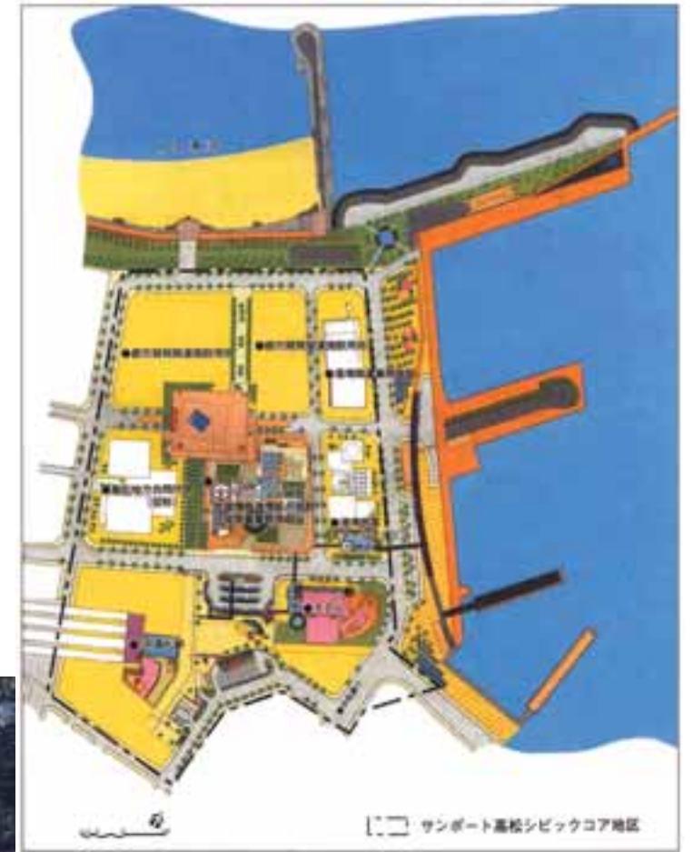
地区全体の配置図