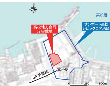
シビックコア地区の位置