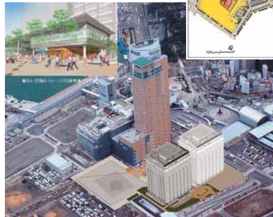
地区全体の航空写真(合成)