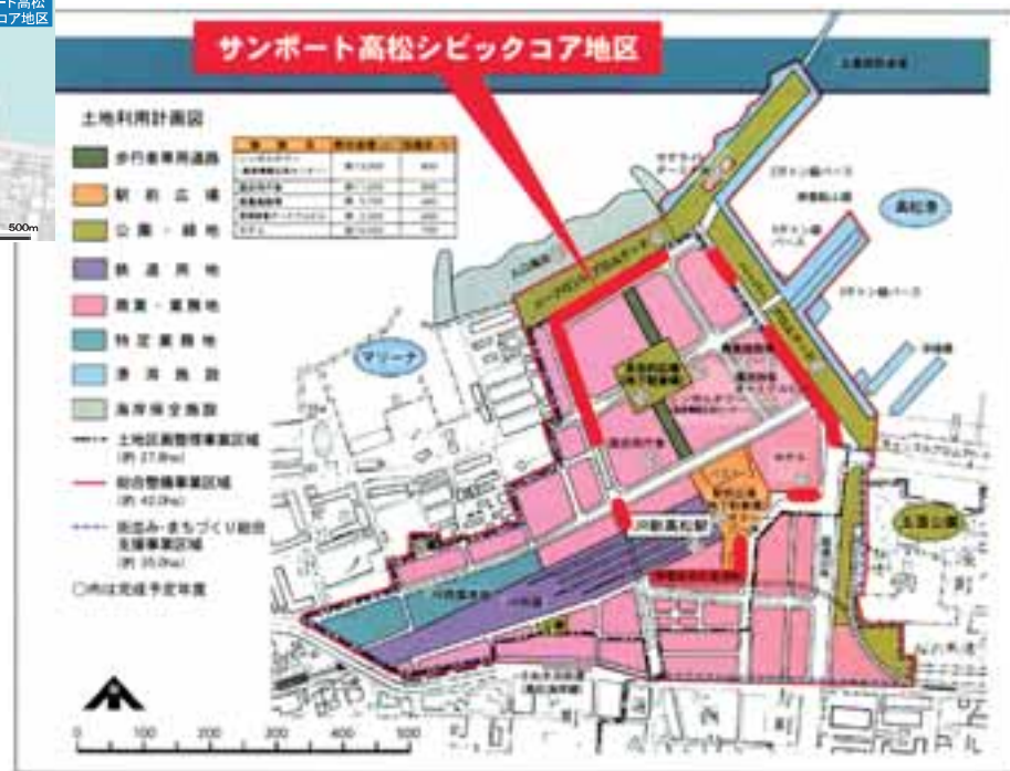
シビックコア地区の区域図