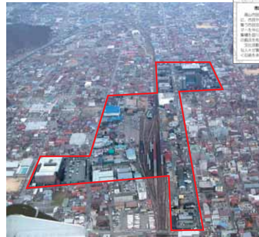
地区全体の航空写真