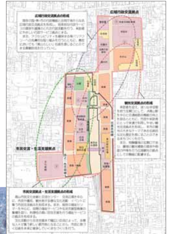
地区全体の配置図