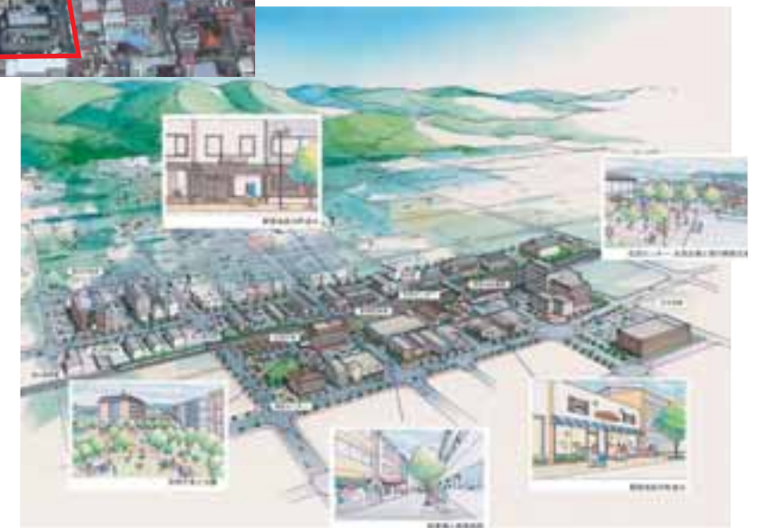
地区全体のイメージパース