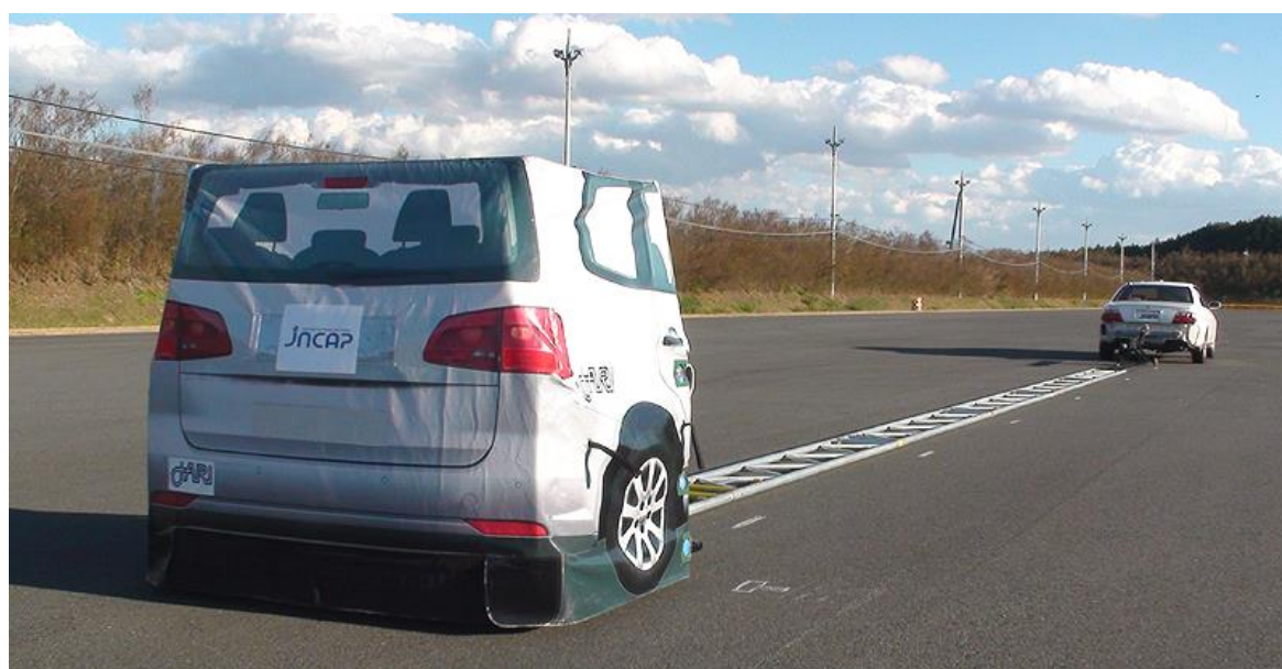
付図 1 試験用ターゲットの外観