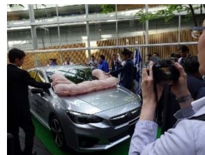
歩行者保護エアバッグの展開デモ