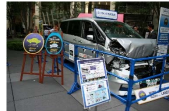
衝突試験車両の展示