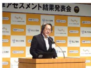
国交省 島自動車局次長挨拶