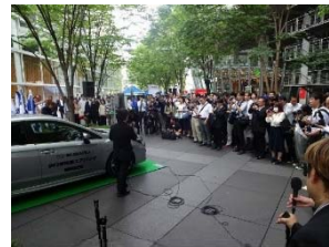
多くの取材カメラ