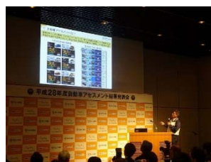
NASVA 大森アセスメント部長のプレゼン