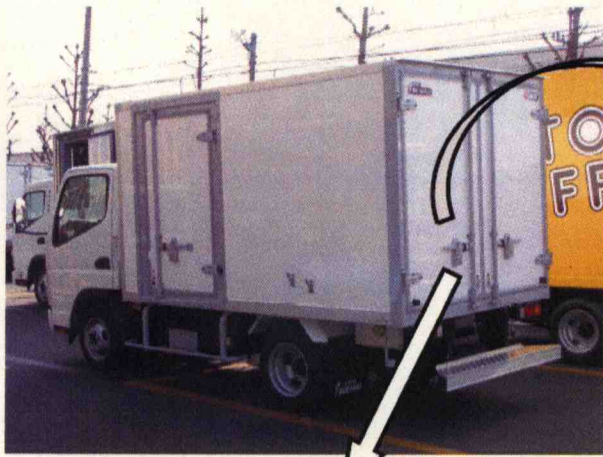
「非常開付きナイスキー」