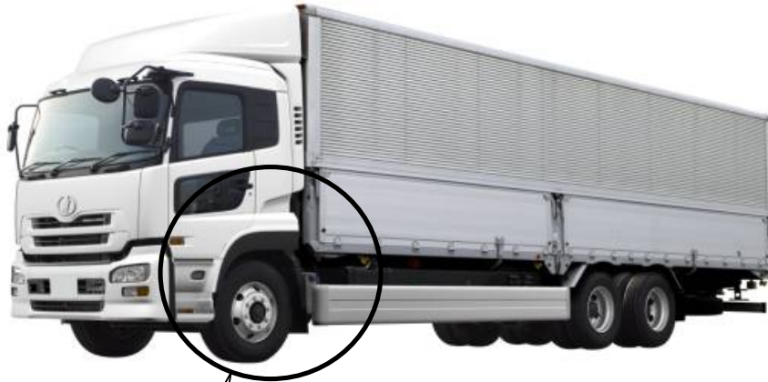
[燃料配管レイアウト]