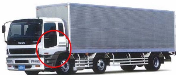
6 S D 1 エンジン搭載車