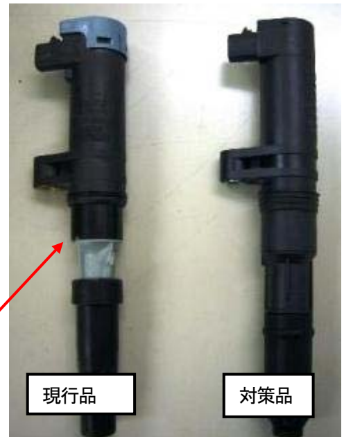
イグニッションコイル