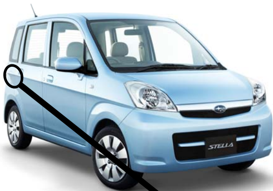
【 ドアロック構成部品 】