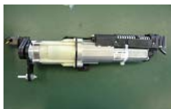
左ドライブユニット