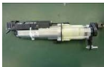
右ドライブユニット