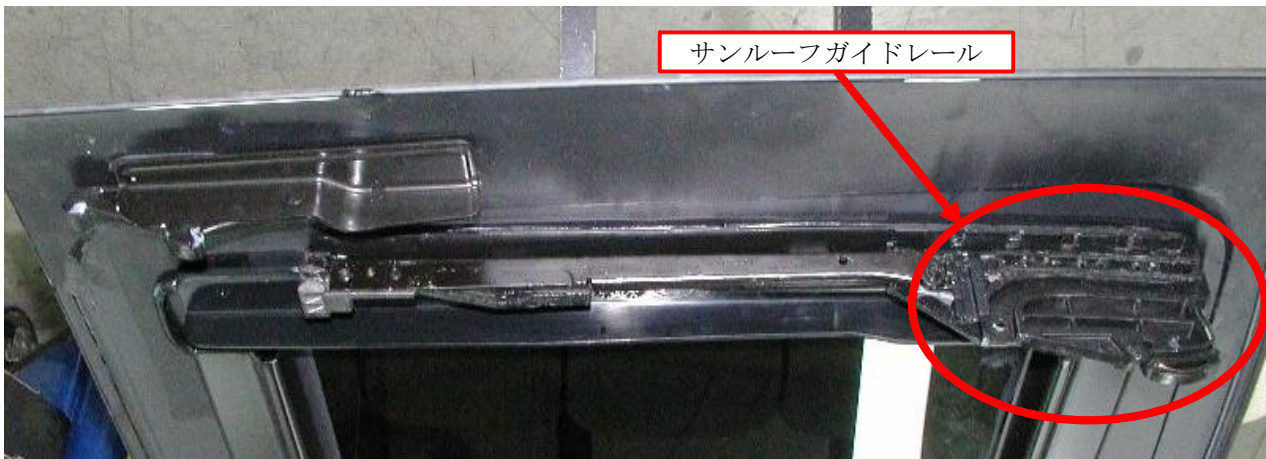
サンルーフガイドレールの修正の詳細写真