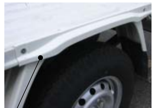
板金製フェンダ 改善後

保冷車、冷凍車などに架装された車両において、後輪タイヤが直上の車体より外側方向に突出している場合があるため、保安基準に適合しないおそれがある。