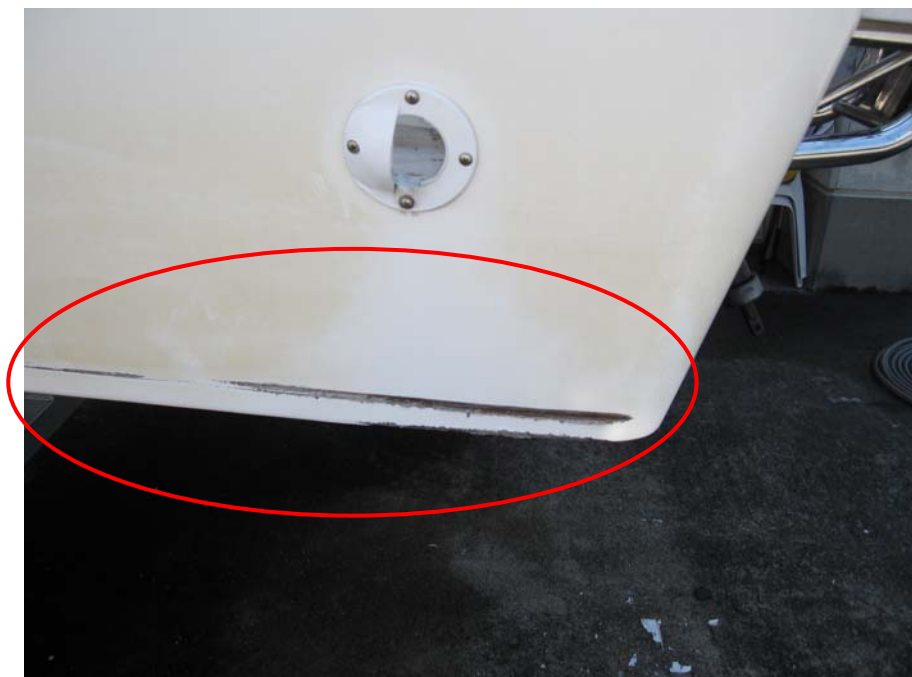
写真4 係船杭の状況