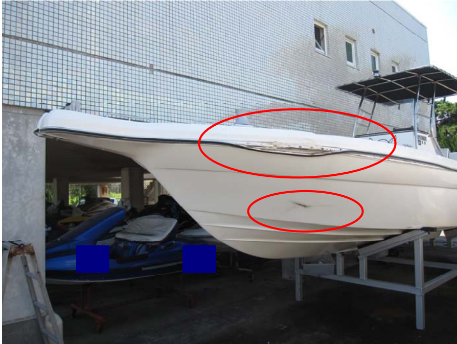
写真2 本船の損傷状況（左舷中央下部）