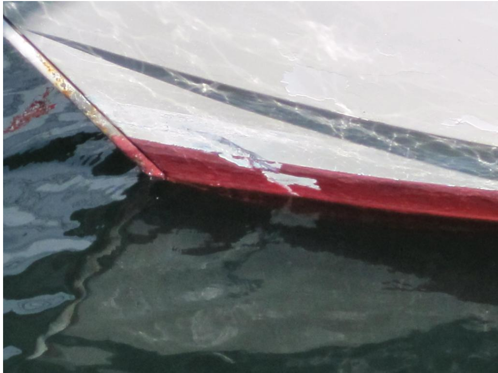
写真2 B船の損傷状況