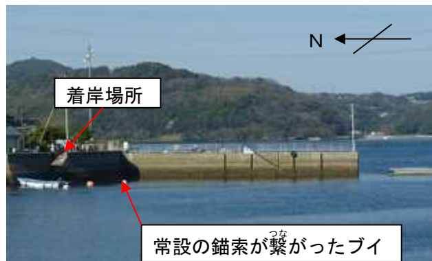
写真1 小郡岸壁の状況

平成27年1月12日08時57分ごろ、船首が同岸壁に強く当たった。(写真1参照)