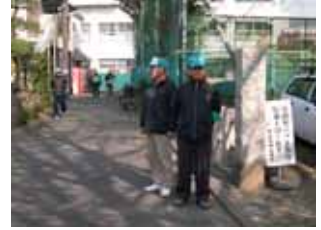
【補助を受けて購入した物品と防犯活動の様子】