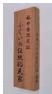
【「ふくいの伝統的民家」認定民家と認定証】