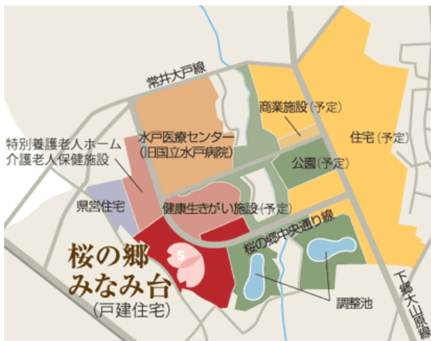
【「桜の郷」土地利用計画図】

所在 茨城県東茨城郡茨城町桜の郷 面積 約57ha（西側約25haを先行整備） 事業主体 茨城県 計画人口 約3,200人