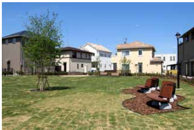
【住宅地内のコモン緑地】

緑に囲まれ、豊かさやうるおいを感じることでできる生活環境の実現を図るもので、ユニバーサルデザインによる人にやさしいまちづくりや公園・コモン緑地など、多数の緑地空間を配置したまちづくりを進めている。