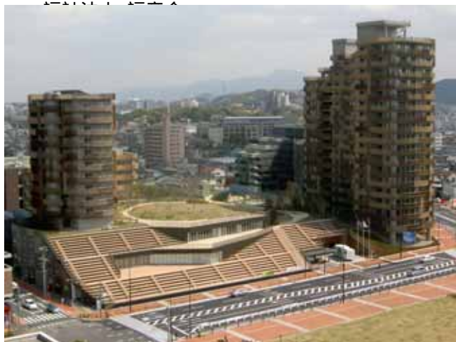
【戸畑C街区整備の様子】