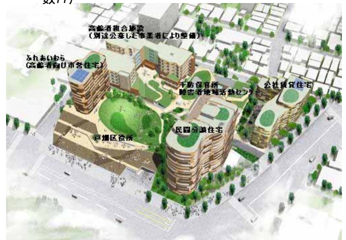
【戸畑C街区完成予想図】

・グループホーム（9人×2ユニット） ・サービスセンター（30人） ・ヘルパーステーション ・住宅供給公社賃貸集合住宅（1～10F（クリニック）） ・地域交流スペース（敷地面積 / 約2,000m 2 ） ・不延床面積 / 約8,100m 2 ） ・住宅数62戸（特定優良賃貸施設） ・民間分譲住宅（B2～18F） ・敷地面積 / 約2,300m 2 （延床面積 / 約14,000m 2 ） ・住宅数77戸