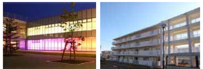
【介護老人保健施設とシルバーハウジング対応の県営住宅】

また、県営住宅の一部には、入居している高齢者の安否確認や各種相談等をライフサポートアドバイザーが行うシルバーハウジング制度を導入している。