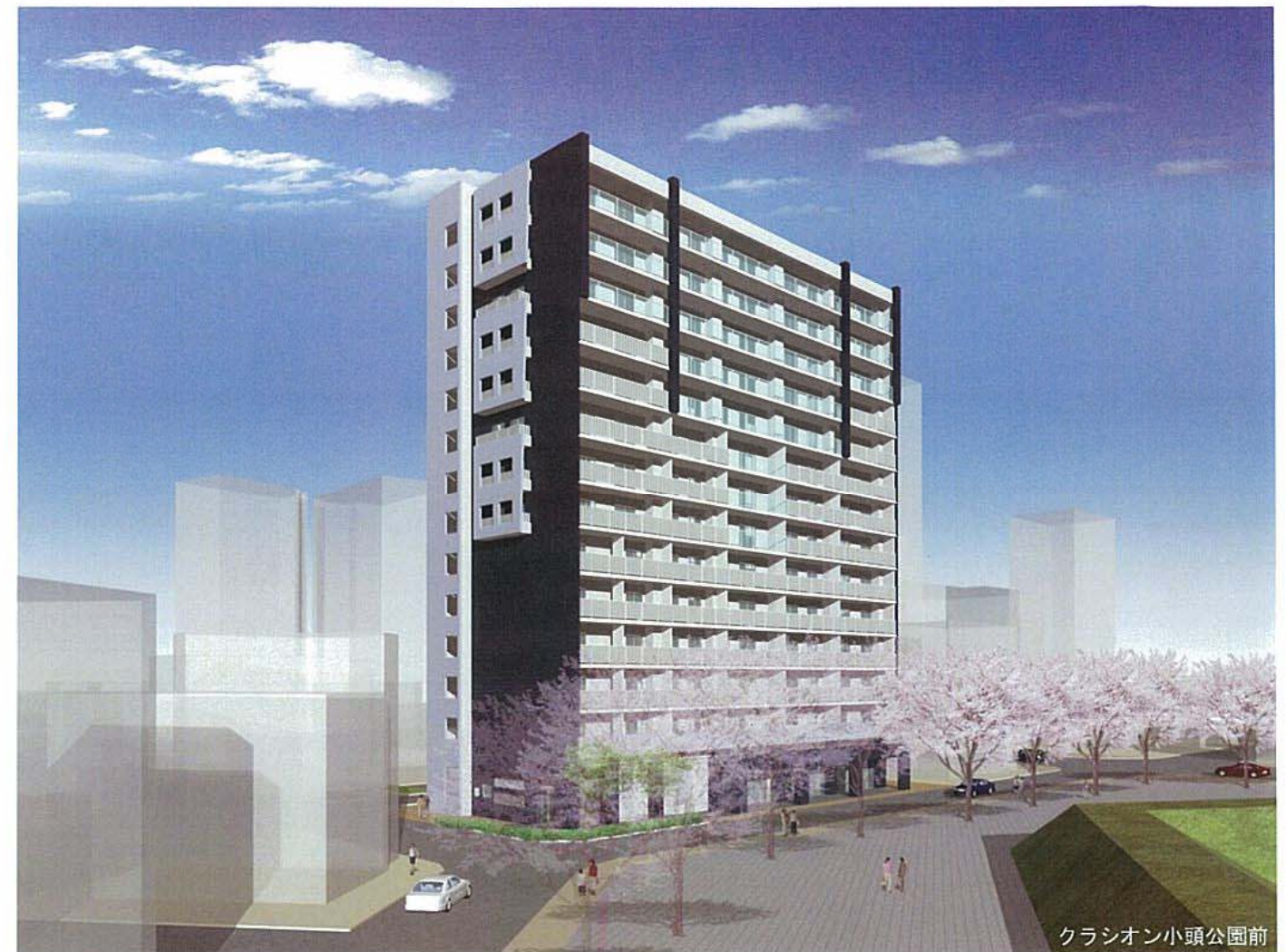
福岡県と久留米市が共同でバックアップ！

住所：東京都千代田区平河町1-7-20 電話：03-5211-0757 メール：sumikae@jt-i.jp ホームページ：http://www.jt-i.jp/