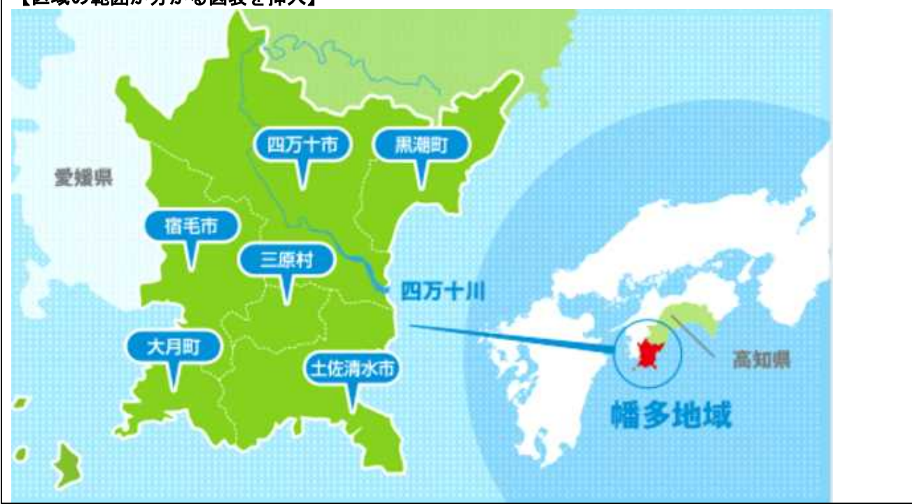
【区域の範囲が分かる図表を挿入】