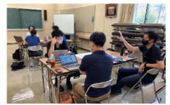
地域における協議