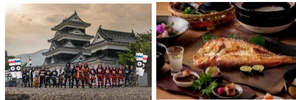
例）文化や食をテーマとしたブランディング