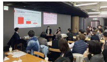
例）地域事業者の商品開発支援