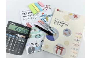
例）中長期的な経営戦略策定