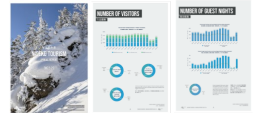
例）地域受益効果の可視化