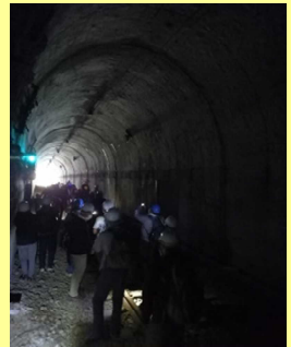
碓氷峠廃線ウォーク