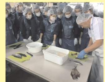
【教育旅行(探究学習)】