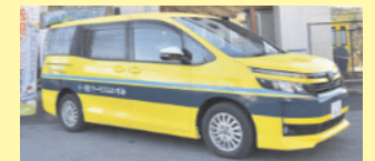
【自家用有償旅客運送】