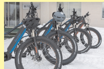
上: E-ファットバイク 下: 道の駅今泉記念館