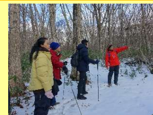
アドベンチャートラベル事業

・台湾からの教育旅行誘致促進のため、山形と台湾の高校生の交流イベントを台湾高雄市にて開催。