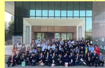
グローバルサミット