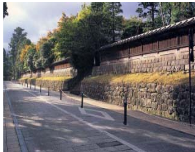
【日光市日光二社一寺地区】