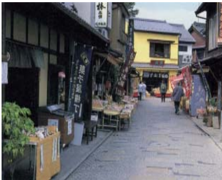
【川越市旧城下町地区】