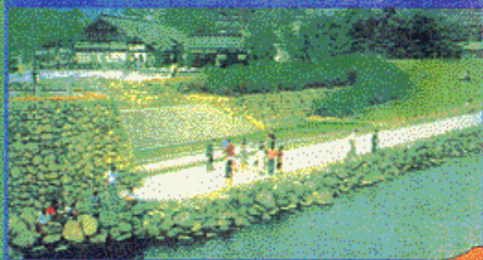
平成元年6月認定 津和野川 (鳥取県津和野町)