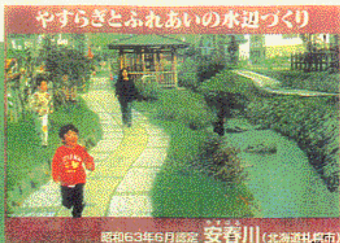
昭和63年6月認定 安春川 (北海道札幌市)