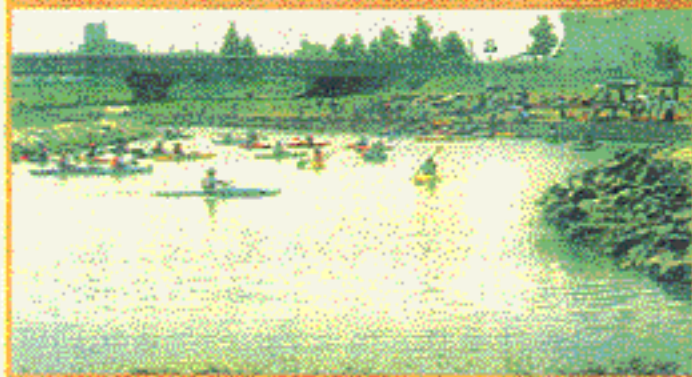
平成3年7月認定 馬込川 (静岡県浜松市)