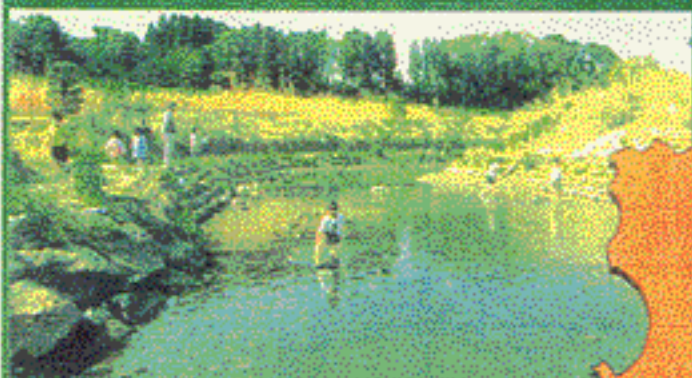
平成元年6月認定 天降川 (鹿児島県国分市)