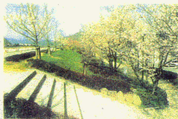
▲ 揖保川 (兵庫県龍野市)