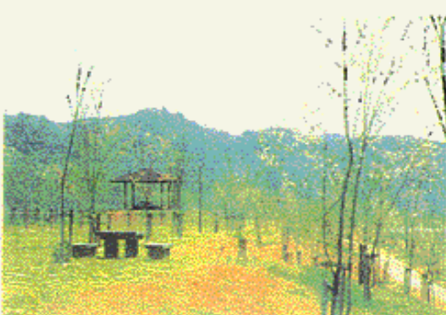
▲ 四万十川 (高知県中村市)