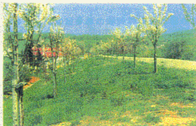
▲ 余市川 (北海道余市町)