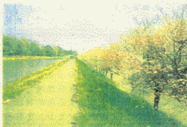
▲ 五行川 (茨城県下館市)