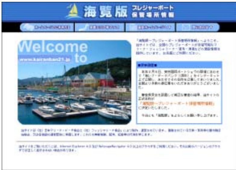
< 「海覧版」のイメージ >

インターネットを利用して、マリーナやフィッシャリーナなどプレジャーボートの保管施設の利用状況や、ビジターの受け入れの可否、サービス内容などの情報を無料で提供します。プレジャーボートユーザーの方だけではなく、広く一般の方にも楽しんでいただけるような充実したサイトを目指します。