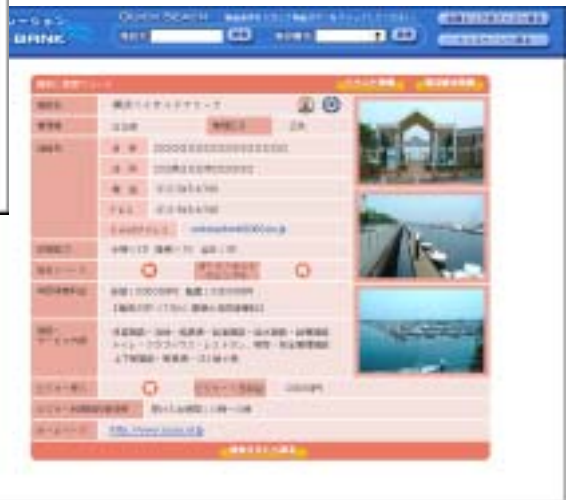
< 保管場所情報のイメージ >