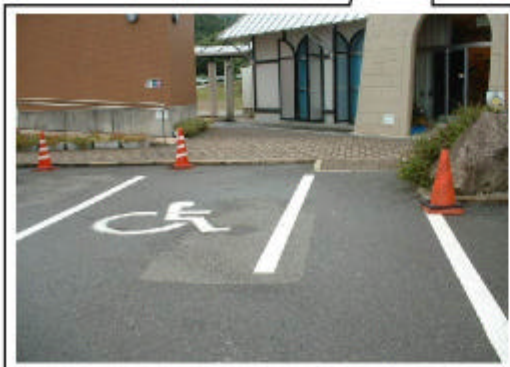
身障者用駐車マス