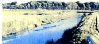
農地・斜面林・水辺が一体となった景観 (加田屋川周辺)