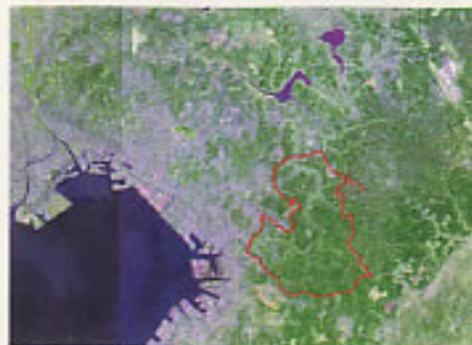
図 ランドサット写真