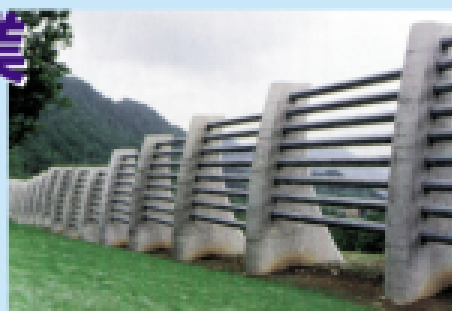
雪崩防止工 (新潟県中魚沼郡津南町)

●砂防工事建設現場などでも雪崩が発生する可能性があります。十分に注意してください。