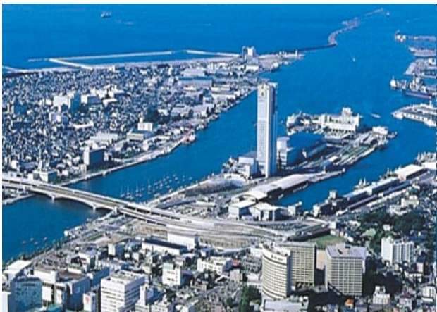
朱鷺メッセと新潟港（新潟県新潟市）

日本海を挟み北東アジア諸国と対面する地理的優位性を活かし、世界中のヒト・モノ・カネ・情報が集まり多様な交流活動が展開される、国際的な交流拠点圏域を実現する。