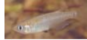
リバーフロント整備センター（1996）より

産卵：5月～7月に小川、池沼、水田、水田または用水路の岸近くの水面に浮いている藻や水草に産卵。仔稚魚は水田側溝や用水路泥底などで成長。