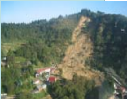
土砂災害（新潟県山古志村）