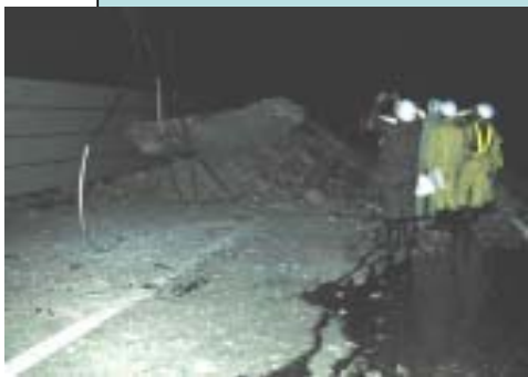
道路災害（国道17号：和南津山町）