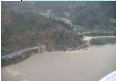
土砂災害（新潟県小千谷市）