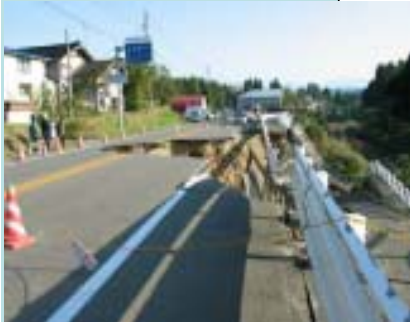
道路災害（国道17号：川口町）