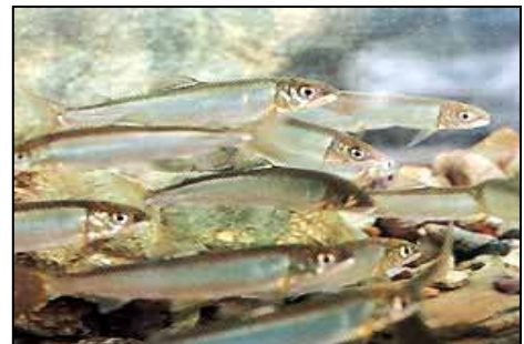
リュウキュウアユ