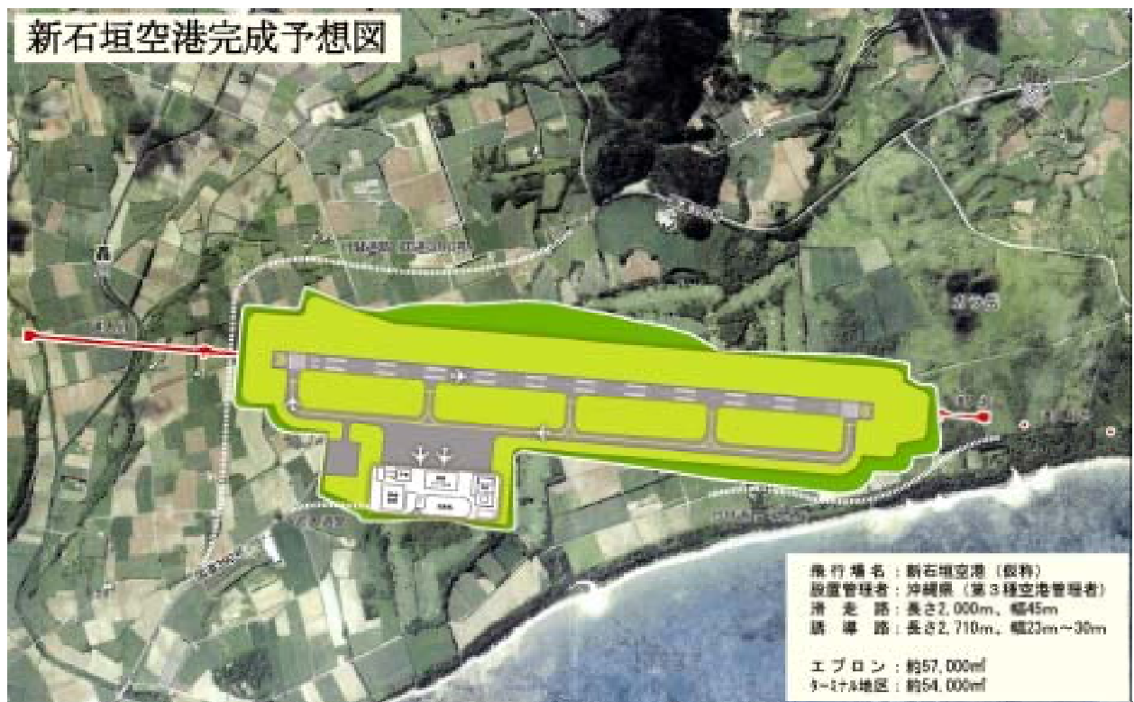
新石垣空港完成予想図