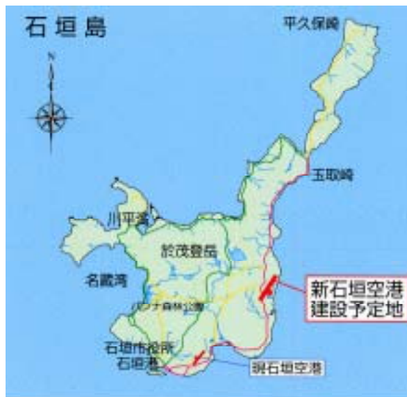
新石垣空港建設予定地